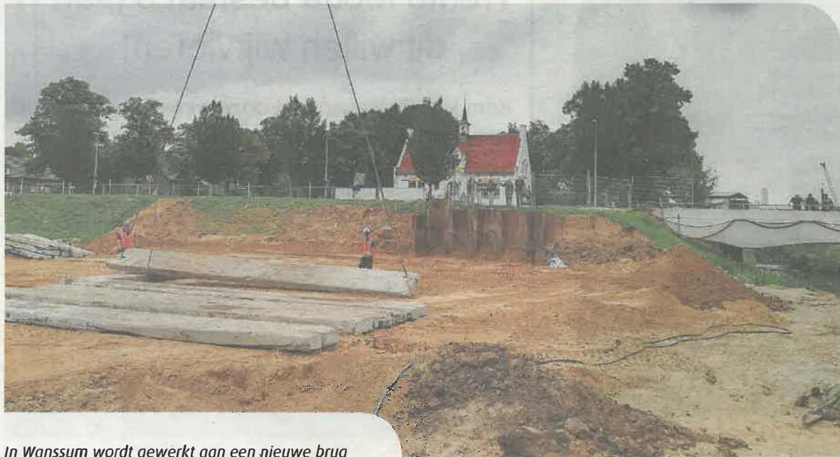
In Wanssum wordt gewerkt aan een nieuwe brug